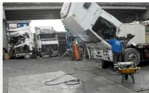
Un operario procede a desmontar una cabina tractora.

Cuando un camión entra en las instalaciones de Gabino Abascal, bien como consecuencia de un siniestro o fruto de se ha retirado de la circulación porque ha puesto fin a su ciclo de vida, lo primero que se aborda es su