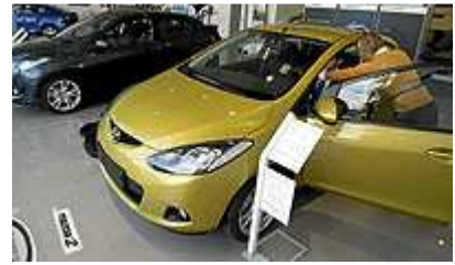
Disminuye la venta en concesionarios.

Romero-Haupold utiliza esta expresión para definir el 'statu quo' de los 3.500 concesionarios que forman la asociación, con un nivel de empleo directo e indirecto de más de 170.000 personas, según los últimos datos oficiales.