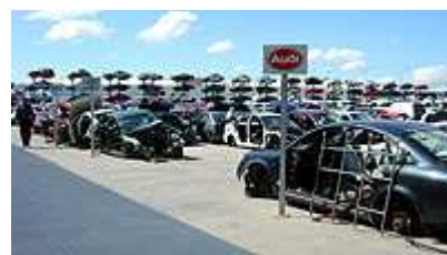
La antigüedad del vehículo para achatarrar disminuye a 10 años.

Contando con la buena acogida de Industria, al plan de Faconauto le quedaría salvar el gran escollo: que lo acepte Economía. Para lograrlo ponen encima de la mesa unas cuentas según las cuales el Estado se encontraría con un superávit de 251 millones de euros, pues al coste estimado de 521 millones se enfrentarían unos ingresos vía impuestos de 772 millones. Aunque para ello se estima que se acogerían a las ayudas unas 530.000 operaciones, lo que supone tomar como referencia los mejores años del extinto Prever.