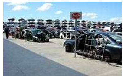
Los coches a entregar deben tener más de 15 años

En opinión del sector automovilístico, las condiciones del Vive resultan insuficientes y muy restrictivas ya que para poder acogerse a las ayudas hay que achatarrar a cambio un vehículo con más de 15 años de antigüedad. Y comprar otro que emita menos de 120 gramos de CO2 por kilómetros. O hasta 140 gramos si el vehículo está equipado con elementos de seguridad como el control de estabilidad ESP o los avisadores de los cinturones de seguridad. Además, el importe de la operación no puede superar los 20.000 euros . De esta cantidad, los primeros 5.000 euros se financian a un tipo de interés cero y el resto, al Euribor más el 2,5%. La subvención de los intereses corre a cargo del ICO. Asimismo, a todo ello hay que sumarle la coyuntura actual marcada por el incremento de la morosidad y con las entidades financieras cerrando el grifo de los créditos, lo que dificulta la obtención del préstamo por parte del comprador.