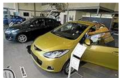
Los coches que subvenciona el Vive no pueden emitir más de 140 gramos de CO2.