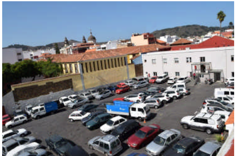
En el patio del Ayuntamiento se estaban acumulando los vehículos retirados de la vía pública

Además, desde el área de Seguridad Ciudadana se han acelerado los procesos administrativos que han permitido enviar al desguace unos 60 vehículos en estado de abandono, según informaron desde el Consistorio.