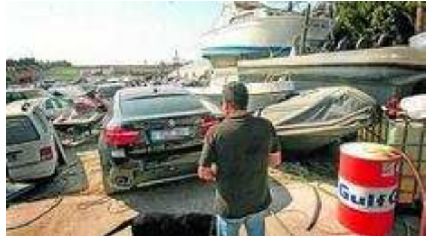
Depósito judicial de Almería, en el que se acumulan 1.842 vehículos cuyos gastos asume la Junta.

La Consejería de Justicia e Interior ha impulsado un proceso para la destrucción de 501 vehículos, de un total de 1.842, que se encuentran en depósito judicial en Almería como consecuencia de un proceso judicial ya finalizado y que no tienen ningún valor económico para seguir conservándolos. Se trata de vehículos que han estado bajo investigación implicados en todo tipo de casos, desde asesinatos, homicidios, operaciones de tráfico de drogas, embargos o incluso accidentes de tráfico, según indicaron desde la propia Junta de Andalucía a este periódico.