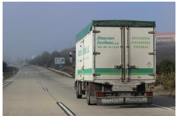
El objetivo de las ayudas es renovar un parque que, en palabras de la vicepresidenta, está "muy envejecido".

La vicepresidenta del Gobierno, Soraya Sáenz de Santamaría, ha anunciado hoy, 7 de noviembre, en la rueda de prensa celebrada tras el Consejo de Ministros, que el Gobierno ha aprobado una subvención por valor de 4,7 millones de euros para el achatarramiento de autobuses y "vehículos de transporte de mercancías con capacidad de tracción propia de más de 3,5 toneladas de masa máxima autorizada, con una antigüedad mayor de ocho años".