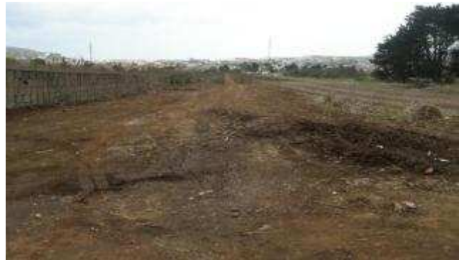
Aspecto que presenta ahora el suelo afectado, que es el de protección agrícola.

La Agencia de Protección del Medio Urbano y Natural (Apmun) ha desalojado el desguace ilegal que funcionaba en la calle La Atalaya de Camino Tornero. Después de agotar la vía administrativa, a través de la que había llegado a multar a su propietario con más de un millón de euros, la Agencia que depende del Gobierno de Canarias decidió ejecutar de manera subsidiaria la limpieza de la chatarra, que estaba desperdigada sobre 2.345 metros cuadrados de suelo rústico protegido por su alto valor ambiental.