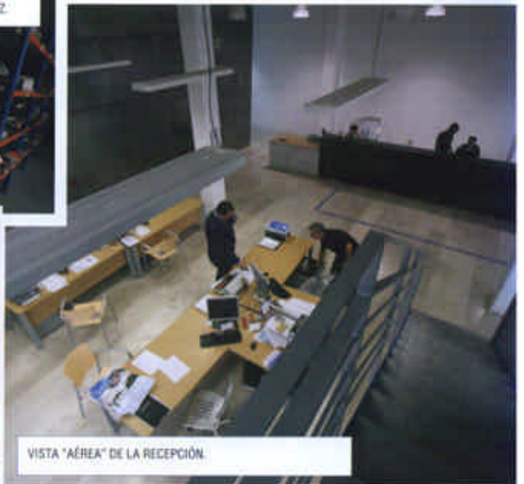
VISTA "AÉREA" DE LA RECEPCIÓN.