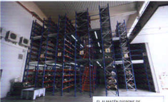
EL ALMACÉN DISPONE DE 25 000 REFERENCIAS.