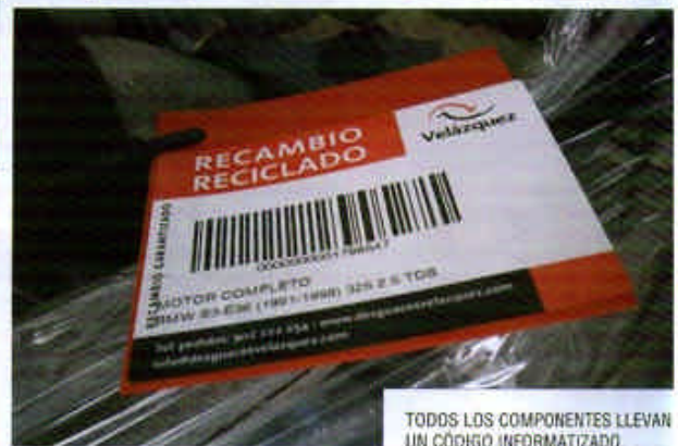
TODOS LOS COMPONENTES LLEVAN UN CÓDIGO INFORMATIZADO.

Ser una empresa vanguardista. Superar el concepto de desguace tradicional. Velázquez Reciclado de Vehículos se ha planteado dejar atrás la vieja imagen de una cama llena de vehículos aplastados y un cliente con un destornillador. El resultado ha sido un edificio de diseño, con una fuente en la entrada, una sala de espera moderna y funcional, unas oficinas propias de un despacho del centro de cualquier capital y un sistema de trabajo mecanizado e informatizado que permite trabajar de manera limpia y eficaz y atender a los clientes con rapidez y calidad.