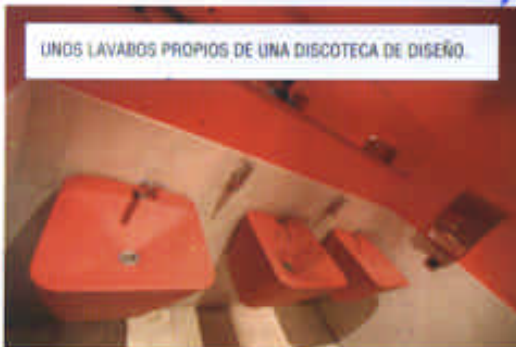
UNOS LAVABOS PROPIOS DE UNA DISCOTECA DE DISEÑO.