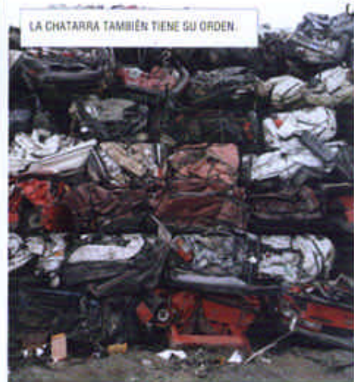
LA CHATARRA TAMBIÉN TIENE SU ORDEN.