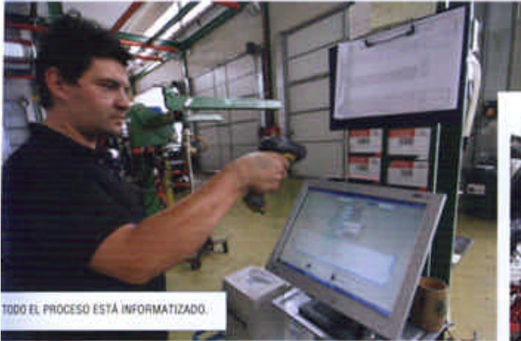
TODO EL PROCESO ESTÁ INFORMATIZADO.