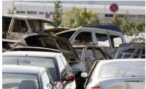
Los imputados simulaban la compraventa de vehículos viejos antes de ser dados de baja y ser desguazados para obtener las subvenciones

La fiscalía reclama penas que suman 62 años de prisión para una red formada por 21 acusados, la mayoría comerciales de concesionarios de vehículos de la isla, que presuntamente estaban concertados con dos empresas de reciclaje de automóviles para adquirir coches de desguace y que los clientes que se iban a comprar un modelo nuevo pudieran cobrar el Plan Renove, la ayuda pública estatal de 500 euros.