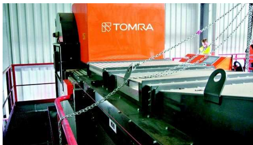
Ya son varios los países europeos que alcanzan los objetivos de reciclaje, reutilización y recuperación del 95 %.

Ya son varios los países europeos que alcanzan los objetivos de reciclaje, reutilización y recuperación del 95 %. En Alemania, por ejemplo, la introducción de su política de 'vertido cero' provocó el cierre de numerosos depósitos controlados y exigió la consiguiente inversión en centrales de ciclo combinado (calor y electricidad). El tipo de viviendas en Alemania incluye una alta proporción de apartamentos, pisos y viviendas plurifamiliares, por lo que estas centrales se integran cerca de las viviendas para proporcionar la calefacción y energía necesaria a las comunidades locales. En esta situación, el incorporar residuos de VFU como combustible para la incineración da respuesta a las necesidades de la comunidad y cierra el círculo en el proceso de la gestión de residuos.