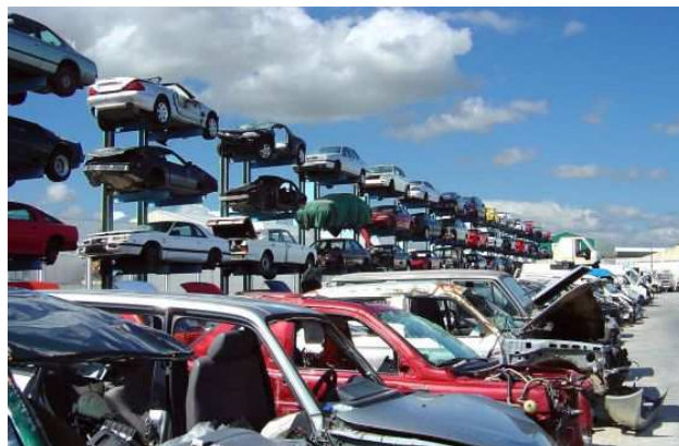
Imagen de archivo de una planta de desguace en Madrid.

La Agencia Tributaria ha completado hoy una gran operación contra el fraude fiscal por las ventas en negro de piezas de recambio de vehículos por parte de centros de desguace. Hacienda ha llevado a cabo el registro de 60 locales de 45 empresas en siete comunidades autónomas por indicios de que ocultaban en torno a la mitad de las ventas de piezas de recambio a talleres y particulares, según fuentes de la investigación, en lo que ha denominado Operación Ballesta.