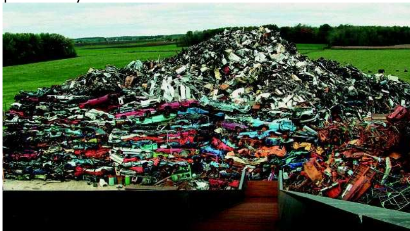
Los VFU tienen un importante potencial en cuanto a la valorización y recuperación de los materiales que los componen.

En España, cada año van al desguace más de un millón de vehículos que producen una media de 800 kg. de chatarra por cada coche en desuso. Según datos de SIGRAUTO, la Asociación que agrupa al sector español de tratamiento de VFU, en 2013 se trataron 734.776 vehículos y en los próximos meses esperan publicar la cifra de 2014 que se prevé muy similar.