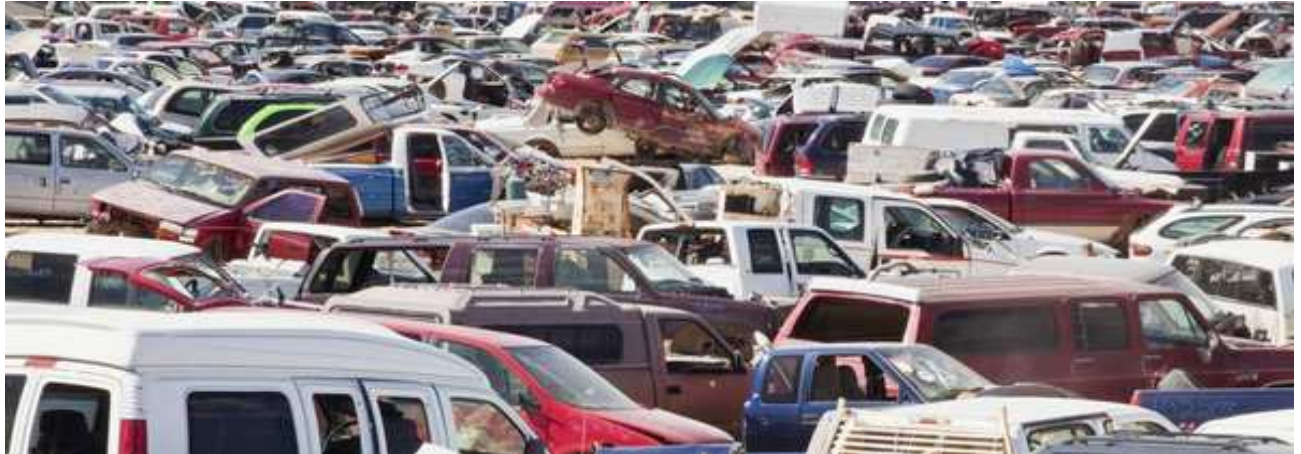
El nuevo PIVE acaba con la picaresca de cobrar por coches de desguace

Desde el lunes la ayuda se condiciona a que el vehículo que se achatarra se tenga en propiedad al menos un año y con la ITV en vigor