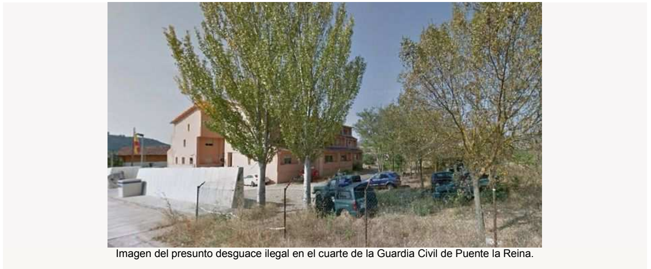
Imagen del presunto desguace ilegal en el cuarte de la Guardia Civil de Puente la Reina.

La Asociación de Suboficiales ha exigido una rectificación por atentar contra el honor de uno de sus asociados, el responsable del cuartel a quien se dirigen las críticas por permitir el abandono de vehículos.