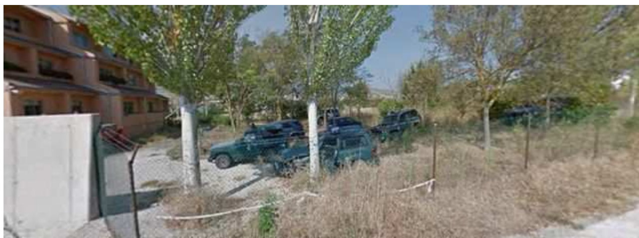
Desguace de la Guardia Civil en Puente la Reina.

El Observatorio de la Ciudadanía contra la Corrupción Civil ha interpuesto una denuncia por la existencia de un desguace ilegal dentro de las dependencias de un cuartel de la Guardia Civil en Navarra.