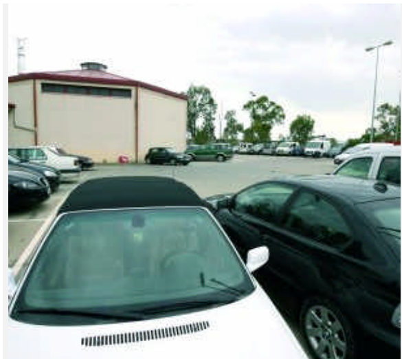
Depósito municipal de vehículos

El caso se encuentra en los primeros pasos de la fase de instrucción. El policía denunciado declaró ante el titular del juzgado, auxiliado por un abogado defensor. En su declaración aseguró que es inocente y que es víctima de una trama contra su persona.