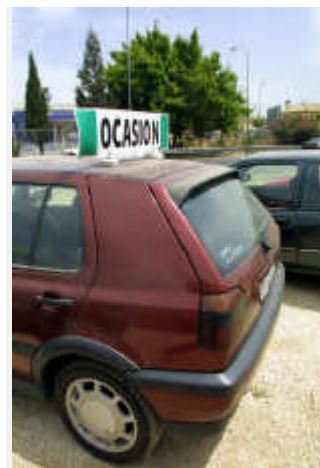
Un vehículo 'espera' el momento para cambiar de dueño

Pero ¿qué ocurre cuando no se tiene en propiedad un coche con más de doce años? ¿Y cuándo se posee un vehículo de más de doce años pero no interesa comprar otro? El plan PIVE puede dar una solución perfecta a estas dos circunstancias, ya