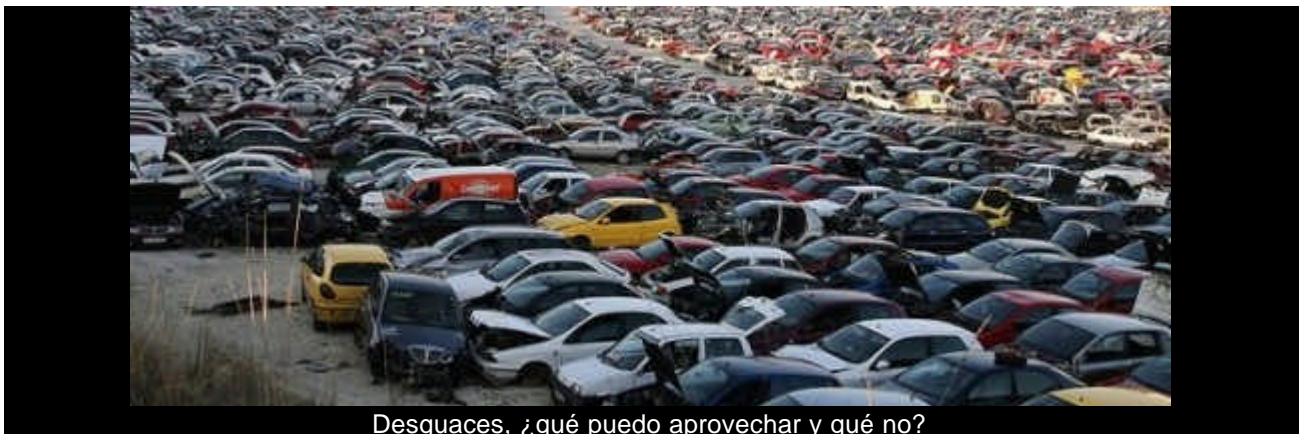
Desguaces, ¿qué puedo aprovechar y qué no?

Seguro que a todos nos ha descuadrado el mes alguna avería imprevista de nuestro coche, ¿son los desguaces una opción para ahorrar en la reparación de nuestro vehículo? Desde comienzos de la crisis, los desguaces se han convertido en verdaderos supermercados de fin de semana donde manitas se dan cita para reparar sus vehículos a bajo coste, ¿merece la pena?.