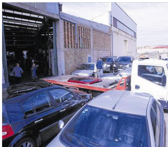
Cada vez más un mayor número de ciudadanos llevan sus coches antiguos al desguace.