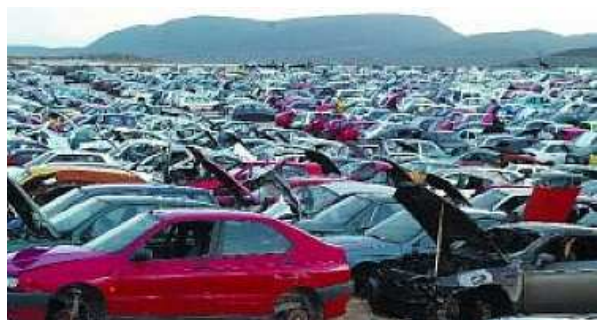
Cientos de vehículos ya descontaminados se alinean por marcas en los exteriores del desguace La Cabaña, entre Berrioplano y Loza, antes de pasar por la prensa.

Dos de cada diez automóviles llegan después de un accidente de tráfico y el resto, por longevidad. La cifra de vehículos desguazados en la Comunidad Foral es similar a la de turismos y todoterrenos matriculados en 2007, que ascendió a 16.817. En cualquier caso, hay que tener en cuenta que algunos desguaces navarros tienen centros de recogida de vehículos en Rioja y País Vasco, y que entre los vehículos tratados están incluidos los camiones y vehículos industriales.