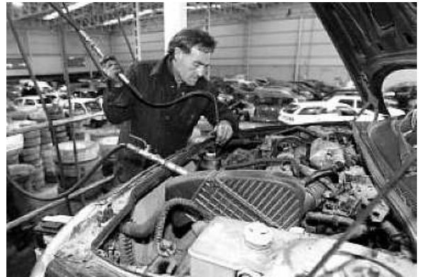
1. DESCONTAMINACIÓN. Todo vehículo que llega a un desguace debe ser descontaminado. Para ello, se extraen los líquidos de frenos y refrigeración, los anticongelantes, aceites, baterías y valvulinas. Todo ello se almacena en contenedores especiales para su tratamiento por empresas certificadas. Lo mismo ocurre con los neumáticos. Sólo los nuevos son vendidos. GOÑI