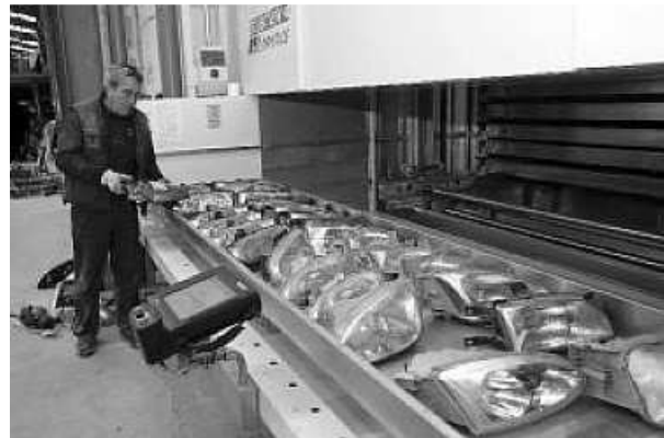
3. ALMACENAMIENTO Las piezas se almacenan en bandejas según el tipo (focos, parachoques, retrovisores...) y el modelo de vehículo. El sistema de almacenamiento, como en la imagen, puede estar informatizado y automatizado. Este sistema permite un fácil control de las piezas disponibles así como su registro en una página web de Internet. Los usuarios pueden optar por comprar a través de la red o en el mismo taller de desguace. GOÑI