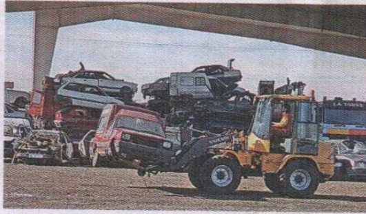
El desguace es el primer paso del reciclado de coches. S. CH.

● Los 150.000 vehículos desmatriculados al año pasan al Sigrauto, un sistema de desguace controlado. Los materiales peligrosos se retiran, se separan los reutilizables (como un parasol) y los fragmentos metálicos acaban en fundiciones. "El 85% del peso del coche se recupera", asegura Rafael Prado, de Sigrauto.