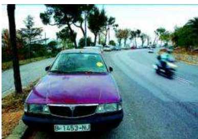
Un coche abandonado en la calle del Polvorí, en la montaña de Montjuïc, el viernes.

El Ayuntamiento de Barcelona retira más de 10.000 vehículos abandonados en un año, lo que se traduce en que son 28 los coches y motos que se dejan a diario en las calles con la intención de que la grúa los lleve al desguace. Sant Martí es el distrito con más abandonos, 1.657.