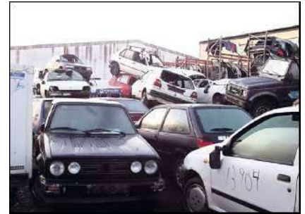
Antes de ser deshechos, los coches se descontaminan.

PALMA. No falla: diciembre es el mes en el que, en proporción, más coches se dan de baja para ser desguasados. Los conductores apuran el último mes del año para deshacerse de los vehículos que ya no usarán y evitan así tener que pagar el impuesto de circulación del nuevo año en curso. Lo que tampoco falla mientras los desguaces arden durante ese mes del año es la nostalgia y la tristeza que sienten muchos al dejar sus coches: hay quien se sienta por última vez en su interior durante largos minutos;